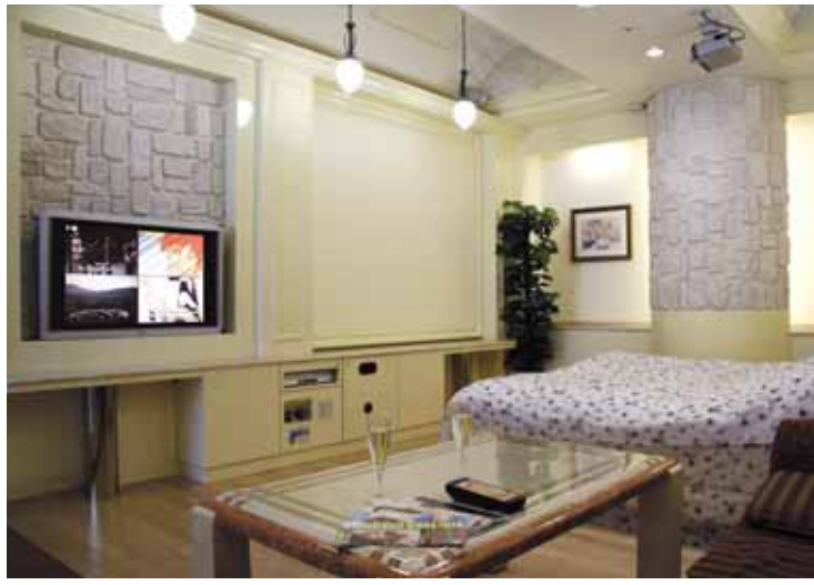
大手のホテルでは、大画面テレビは映像設備としては、あたりまえの時代。 写真は、ASKがご提案するインテリア性を考慮した設置例。 4画面マルチスクリーンの導入は、お客様の満足感をさらに高めます。

近年、ホテルで台頭してきたビデオ・オン・デマンド。実際に導入してみた感想は？ ASKがお勧めする「4画面マルチスクリーン」との徹底比較を行ってみました。